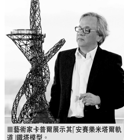
藝術家卡普爾展示其「安賽樂米塔爾軌道」鐵塔模型。

一個名為「我愛旅遊」的大學生旅遊活動吸引了5000名英國學生來到西班牙塔拉戈納省小城沙洛(Salou)，該活動的主題是「陽光、運動、性及無束縛的酗酒」。該活動從上週日持續到本週四，並且4月份還將有第二批4500名大學生將在同一地方舉行同一主題的狂歡。 數百名男女學生化裝或穿著內衣四處橫行，一名年輕小夥把自己裝扮成金剛戰士用高跟鞋裝酒喝，在他附近，一名保安在追趕著一名裸奔者。這些景象就像是瘋狂的電影情節。 據悉，英國學生向來有在考試結束後到國外狂歡的傳統，但在小城沙洛隨處可見著裝奇異，或者半裸的英國學生，他們的粗魯無禮行爲引起了當地居民的強烈反感。一名西班牙當地人朗加